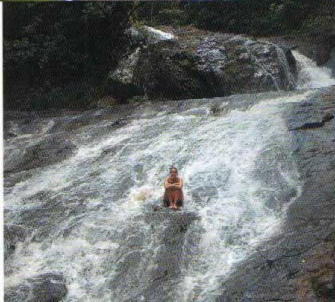
De eco-lodge van Monte Alto