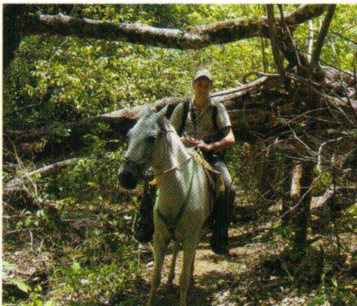
El Salto is alleen te voet of te paard te bereiken